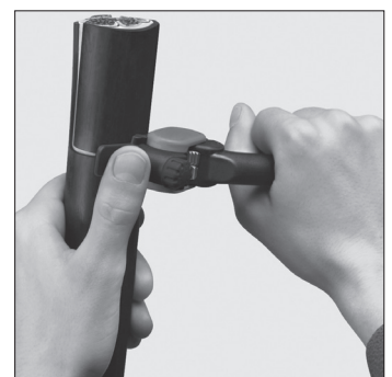
Umfangsschnitt Circular cut