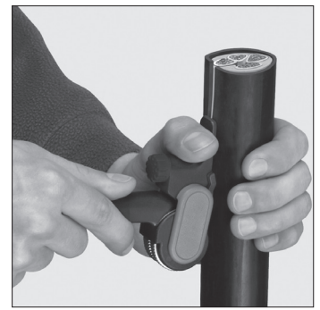
Längsschnitt Longitudinal cut