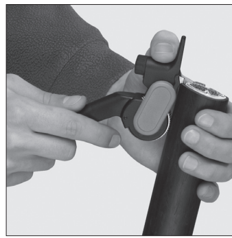
Ansetzen des Werkzeugs für Längsschnitt Setting the tool for longitudinal cut