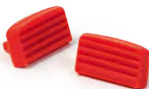
Art. No. 707 003 Auswechselbare Klemmbacken Interchangeable jaws