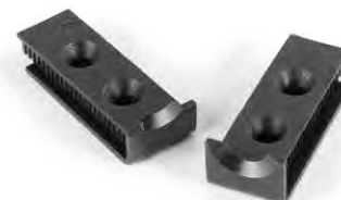
Art. No. 707 012 Auswechselbare Formmesser Interchangeable profile blades