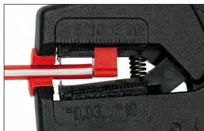
Art. No. 707 001 Querschnittsbereich 0,03–10 mm 2 Cross-section range 0.03–10 mm 2