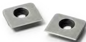
Art. No. 707 002 Auswechselbare Messer Interchangeable blades