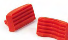
Art. No. 707 013 Auswechselbare Formklemmbacken Interchangeable profile jaws