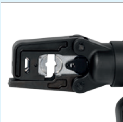
Presskopf mit Klappverschluss, 360° drehbar Crimping head with snap closure, rotates 360°