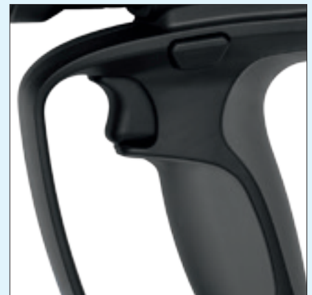
Variable Geschwindigkeit zum Positionieren des Werkzeuges Variable speed for positioning of the tool