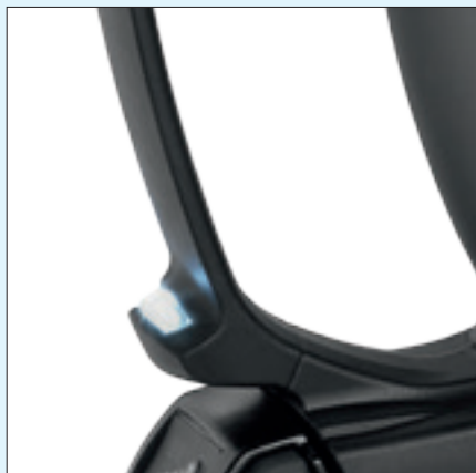
Integriertes LED zum Ausleuchten des Arbeitsbereiches LED for illuminating the work area