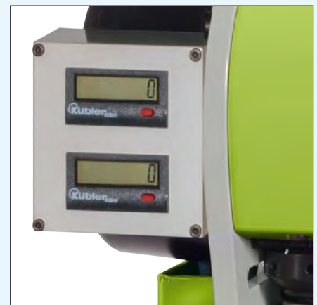
Zähler für Crimpverbindungen Crimp counter