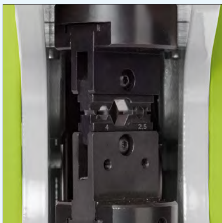
Drehbarkeit der Gesenke Turnable dies

Dies and locators can be used flexibly in hand crimping tool PEW 12, powered tool E-PEW 12 and crimping machine CM 25.