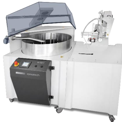
KRI 850 CB