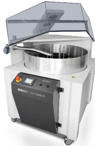
KRI 850 C