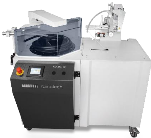
KRI 450 CB