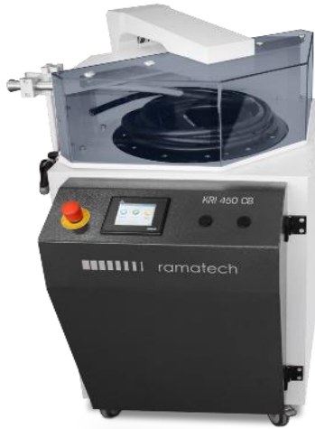
KRI 450 C