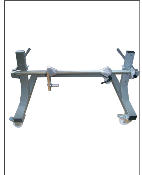
Abb. 5 TROMTRAK 1250 mit Mitnehmerbolzen