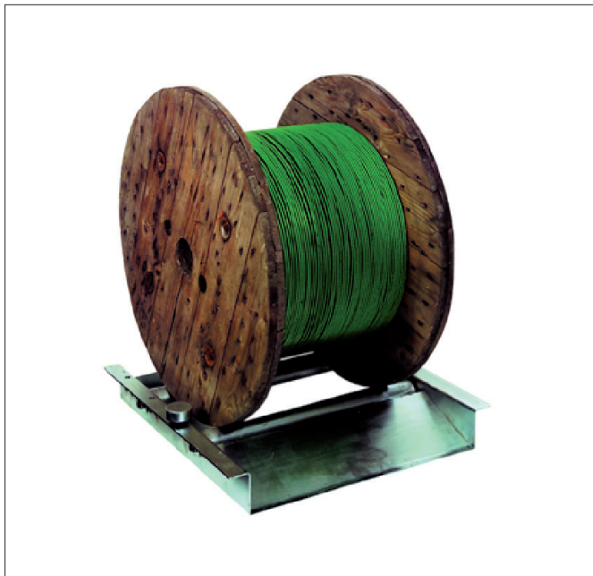
Abb. 3 TROMBOI 800