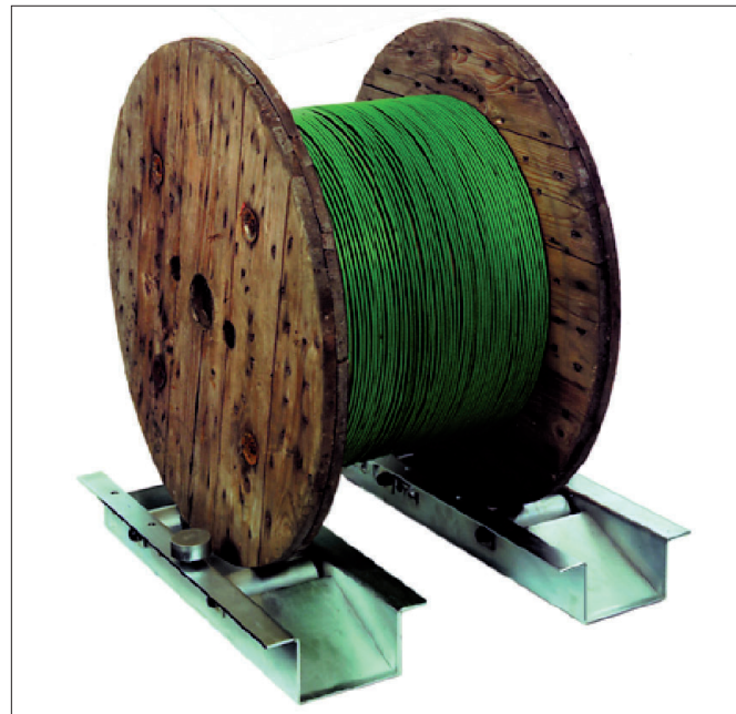
Abb. 4 TROMBOI 1400