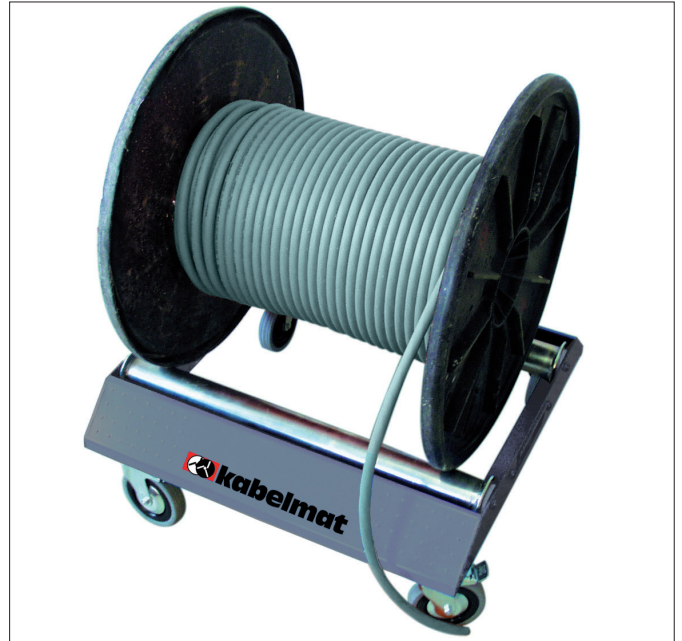
Abb. 2 TROMBOI 500 mit Lenkrollen