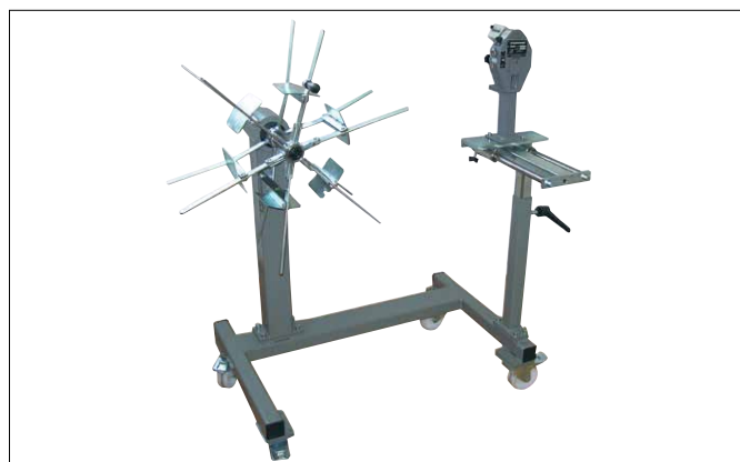
Abb. 2 MESSROL 670 mit MESSBOI 30 und RAPID 600 SP

Die MESSROL Generation stellt ein flexibles Baukastensystem für das manuelle Wickeln dar. Die Vielseitigkeit dieses Systems ergibt sich aus den unterschiedlichen Größen von Ringen, verschiedenen einsetzbaren Mess- und Schneidvorrichtungen, sowie den verschiedenen Haspeln zum Aufwickeln der Ringe. Lenkstoppräder ermöglichen einen variablen Einsatz im Bereich des kleineren Kabeltrommellagers. Selbstverständlich kann mit dem MESSROL System auch aus Trommelregalen, Abwickelsystemen oder Trommelablaufgeräten aufgewickelt werden. Somit wird müheloses Wickeln bei gleichzeitiger Längenmessung gewährleistet.