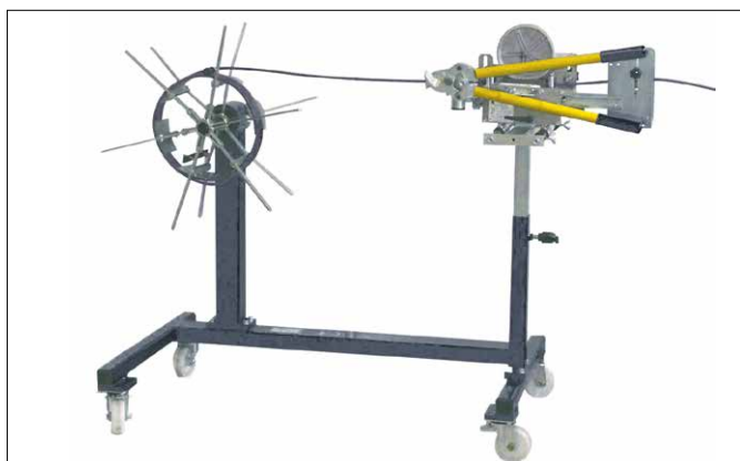
Abb. 1 MESSROL 1000 mit MESSBOI 40 BAE und MATIS 25 M