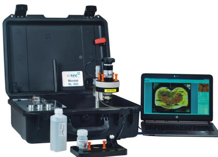
Microlab ML3002 in Betrieb

Portables Labor zur Erstellung von Crimpschliffbildern