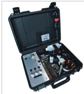
ML im robusten Koffer aus HPX High Performance Resin